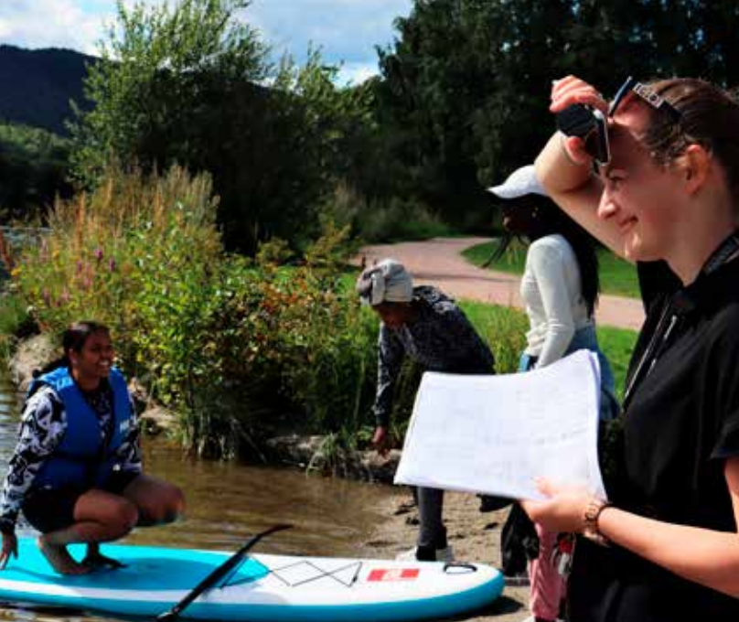
Sammen med Forandringshuset arrangerte Drammen sanitetsforening Sisterhoodcamp. Her fikk jentene prøve seg på vannsport.