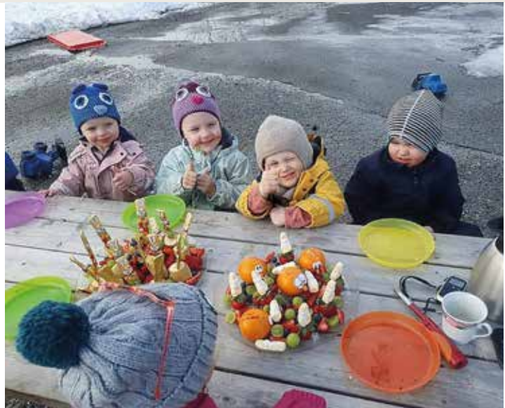
Siden sanitetsforeningene serverte grøt til skolebarn allerede tidlig på 1900-tallet, har Sanitetskvinnene vært opptatt av sunt og næringsrikt kosthold for barn og unge. I dag sørger over 200 foreninger for et godt måltid, enten på skolen eller i barnehagen. Serveringen varierer fra grønnsaker og frukt, til dekket bord med pålegg og brødsiver. Her er det barna i Labbetussen barnehage i Namsskogan som koser seg.