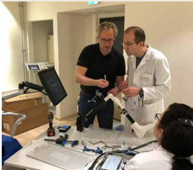
Her utføres kneprotese-operasjonen ved hjelp av en robot på Haugesund Revmatisme sykehus. Moderne teknologi skal gi bedre funksjon og pasienttilfredshet.

Lokal- og fylkesforeningene eier et stort mangfold av virksomheter innen helse- og sosialområdet. Det spenner fra barnevern, spesialisthelsetjenester innenfor revmatisme, geriatri og demens, habilitering- og rehabiliteringsplasser for unge og voksne, til seniorsentre, barnehager og varmtvannsbasseng. Disse driftes gjennom avtaler enten med de regionale helseforetakene eller kommunene.