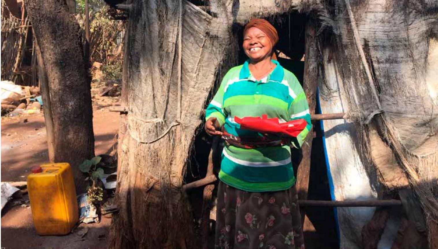
Borgerkrig og pandemien forsterket en allerede krevende hverdag for etiopiske kvinner i året som gikk.