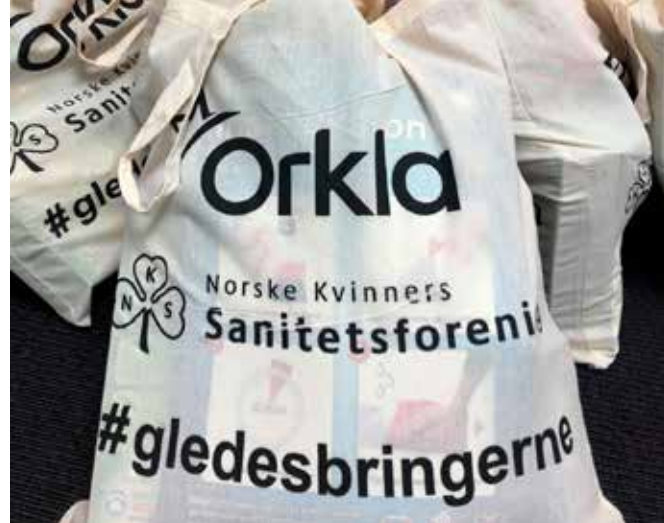
I samarbeid med Orkla #gledesbringerne har bortimot 6 000 voksne og unge i sårbare grupper fått en oppmuntring i en krevende tid.