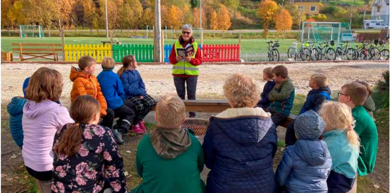
Hvem husker ikke hvor hyggelig det var å bli lest høyt for som barn? Det viser seg at høytlesning ikke bare er kos, det er også god pedagogikk. I koronatiden har Grov sanitetsforening holdt Lesevenn ute i friluft.