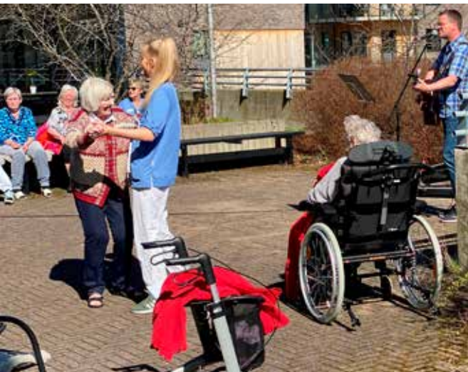
Musikk og dans er livsglede. Du kan nynne med, eller svinge deg med i dansen. Ski og Opegård sanitetsforening arrangerte kulturdag ute. I det flotte solskinet var det mange som inntok dansegulvet sammen med sin kohort.