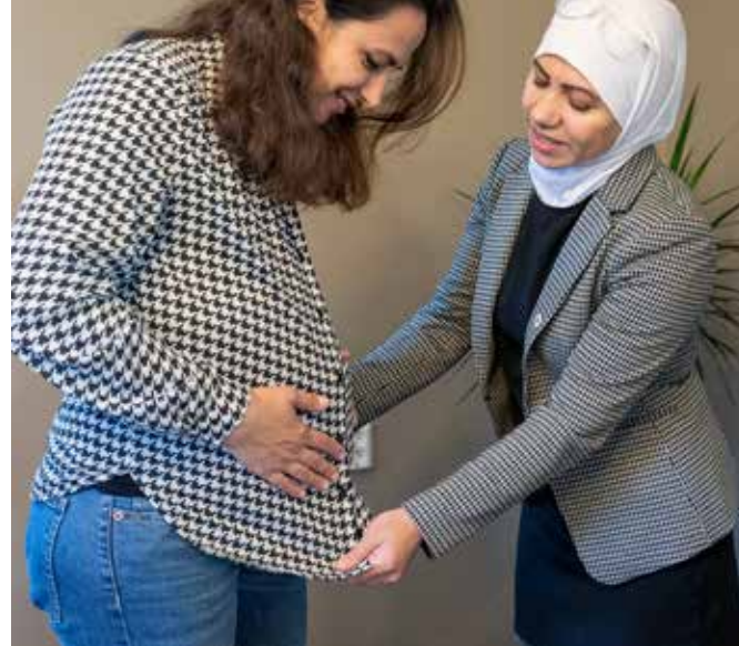
Aldri er vi kvinner så sårbare som når vi skal føde. 120 minoritetskvinner kunne i 2020 få med seg en flerkulturell doula som kunne gi emosjonell og praktisk støtte gjennom svangerskap, fødsel og den første tiden etter.