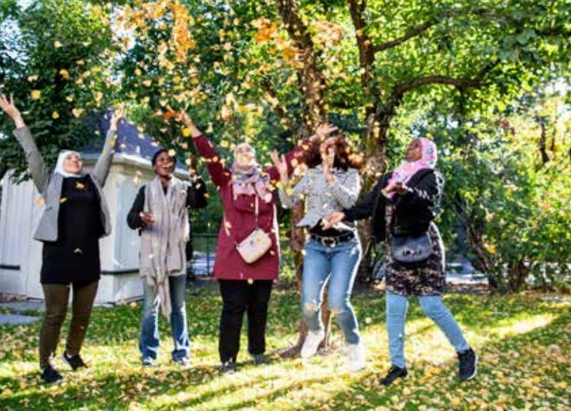
Trygge, gode kvinnefelleskap er viktig når du kommer til et nytt land, og skal lære deg å snakke språket. Høy trivselsfaktor er også viktig. Bildet er tatt fra Språkvenngruppa til Drammen sanitetsforening.