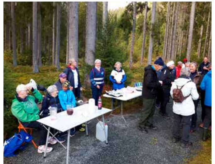
Å gå sammen på tur er et populært lavterskeltilbud som selv i pandemien har vært lett å arrangere. Dette er viktig både for den psykiske og fysiske helsa. Foreningene Spiren og Ekne arrangerte en felles tur, med blant annet natursti med oppgaver.